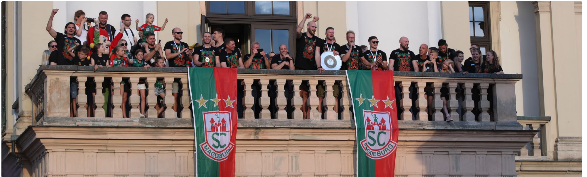
Die Handballmannschaft des SC Magdeburg auf dem Balkon des Alten Rathauses

Deutscher Handballmeister wurde mit Eintrag in das Goldene Buch geehrt